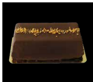
SCHOCGI CAKE 18 x 8 cm Fr. 15.30 Cake 50 cm Fr. 40.00