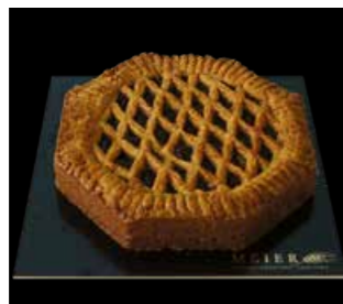
LINZER TORTE 18 cm (8-eckig) Fr. 13.50 Schnitte 50 cm Fr. 40.00