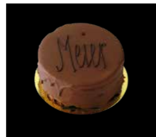
MEIER TÖRTLİ 12 cm Fr. 13.50