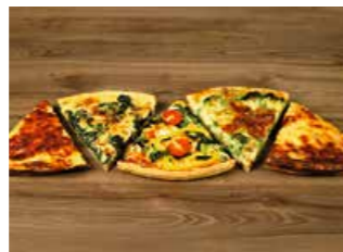
WÄHEN 1 Stück Wähe Fr. 5.50

Auf Bestellung sind alle Sorten 9 x 9 cm erhältlich Fr. 4.60