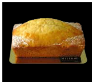
ZITRONEN CAKE 18 x 8 cm Fr. 15.30 Cake 50 cm Fr. 40.00