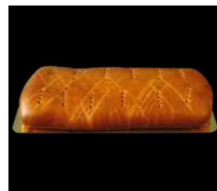
BIRNEN WEGGEN 24 x 10 cm Fr. 9.50