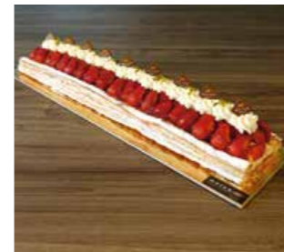
FRUCHT SCHNITTE BLÄTTERTEIG * 50 cm Fr. 45.00