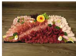
FLEISCH PLATTE GARNIERT * Fr. 9.00 pro 100 g

Und die Früchte Platte ist in Kombination mit unseren Desserts der krönende Abschluss jeder Feier.