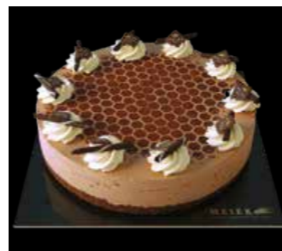
SCHOGGI MOUSSE TORTE

Wir empfehlen 18 cm für 6 Personen, 24 cm für 10 Personen und Carré für ca. 20 – 24 Personen