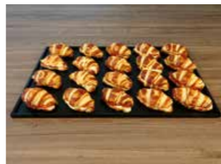
APÉRO LAUGEN GIPFELI GEFÜLLT * Platte gross 20 Stück assortiert Fr. 56.00

Luftiges Laugen Gebäck mit Lachs und Merrettichschaum