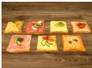
CANAPÉS 6 x 6 cm Fr. 3.20

Für grössere Mengen bitten wir um Vorbestellung.