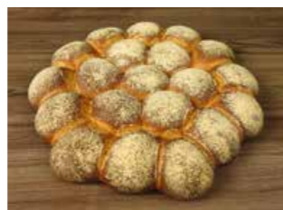
PARTY PLATTE *