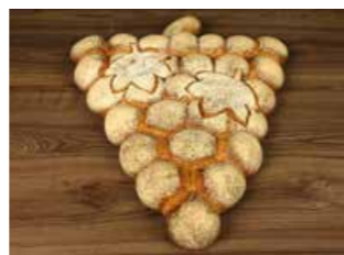
TRAUBEN BROT *