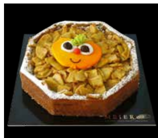
APFEL TRAUM 18 cm (8-eckig) Fr. 15.30