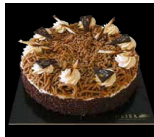
VERMICELLES TORTE (SAISON)

18 cm Fr. 28.00 24 cm Fr. 47.00 Carré 26 x 40 cm (flach) Fr. 97.00