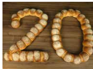
ZAHLEN KRÄNZE *