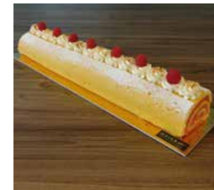
HIMBEER ROULADE SCHNITTE * 50 cm Fr. 45.00