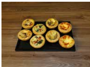
MINI CHÜECHLI * Fr. 2.70 pro Stück

Unser Apéro Gebäck wird mit den besten Zutaten hergestellt. Im Ofen können die kleinen Köstlichkeiten für ca. 10 Minuten bei 180° frisch erwärmt werden.