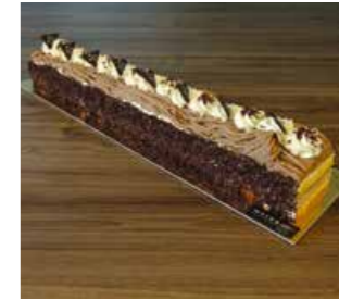
VERMICELLES SCHNITTE (SAISON) * 50 cm Fr. 45.00