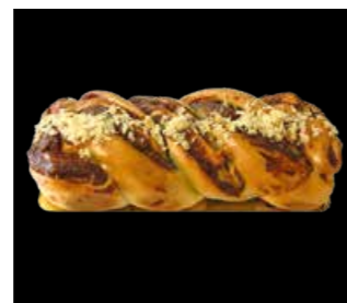
HEFE NUSS STOLLEN 24 x 10 cm Fr. 15.30 Stollen 50 cm Fr. 40.00