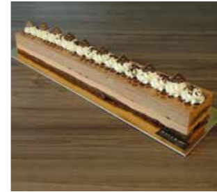
SCHOGGI MOUSSE SCHNITTE * 50 cm Fr. 45.00

Die Länge von 50 cm, ergibt ca. 12 Stück à 4 cm