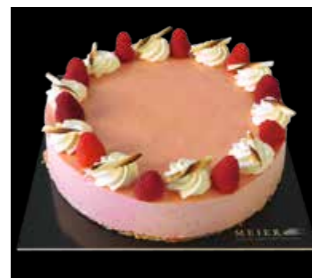
HIMBEER QUARK TORTE

18 cm Fr. 28.00 24 cm Fr. 47.00 Carré 26 x 40 cm Fr. 97.00