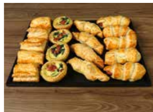
MINI APÉRO GEBÄCK * Fr. 2.70 pro Stück

Mini Chäs Chüechli Mini Pizza Chüechli Mini Lauch Chüechli Mini Spinat/Speck Chüechli