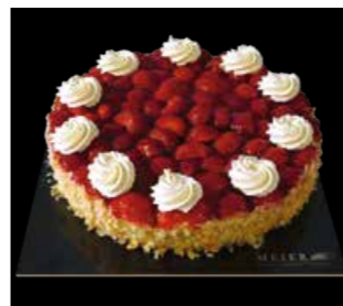
ERDBEER TORTE (SAISON)

18 cm Fr. 28.00 24 cm Fr. 47.00 Auf Bestellung 2 Tage im Voraus