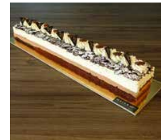
SCHWARZWÄLDER SCHNITTE * 50 cm Fr. 45.00