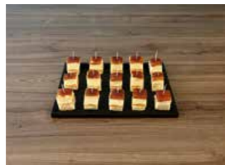
APÉRO LACHS CARRÉ * Mindestbestellmenge 12 Stück Fr. 2.20 pro Stück

Die besonderen Apéro Lachs Carrés sind unsere Spezialität; ebenso die handgerollten Laugen Gipfeli, sorgfältig gefüllt mit Frischkäse oder Mostbröckli.