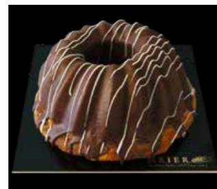
MARMOR GUGELHOPF 18 cm Fr. 15.30