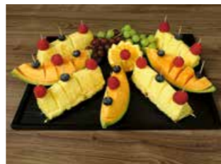
FRÜCHTE PLATTE GARNIERT * Platte gross Fr. 35.00

Als Hauptmahlzeit: Ca. 180 – 200 g pro Person