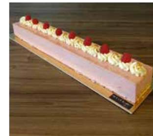
HIMBEER QUARK SCHNITTE * 50 cm Fr. 45.00