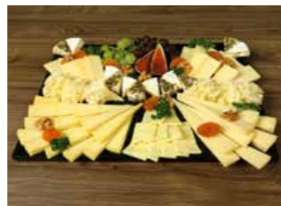
KÄSE PLATTE GARNIERT * Fr. 8.00 pro 100 g

Als Hauptmahlzeit: Ca. 180 – 200 g pro Person