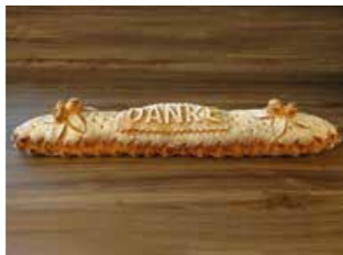
PARTY BROT *

Wie wäre es mit einem Party Brot, einer Party Platte, einem Trauben Brot oder einem Zahlen Kranz?